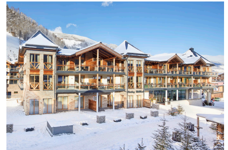
Blickfang mit atemberaubendem Ausblick: DAS WILDKOGEL

Die luxuriösen Châlets, Apartments und Penthäuser laden zum Verweilen und Durchatmen ein - vor, während und nach dem Action- oder Wellness-Tag. Hotelgäste sollen sich so wohl fühlen wie zu Hause und alles haben, was sie sich wünschen. Dazu gehört auch ein TV-Erlebnis der Extraklasse: Wenn Hotelgäste die Beine hochlegen, werden sie dank der IPTV-Integration von Ocilion selbst zum Programmdirektor. Sie können laufendes Fernsehprogramm pausieren und weiterlaufen lassen, bis zu 30 Stunden in die Vergangenheit