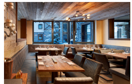
Zeitgemäße Küche mit österreichischen Wurzeln im „Waldvogel“