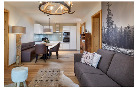
Gemütliches Ambiente kombiniert mit modernem Design

So werden die Gäste umfangreich über die Angebote in den und rundum der Wildkogel Resorts informiert: den exklusiven SPA-Bereich samt Innen- und Außenpool, Fitness- und Saunabereich, Player's Lounge für die jüngeren Gäste oder die breite Menüauswahl der haus-eigenen Restaurants „Bergschmied“ mit italienisch-österreichischen Spezialitäten und „Waldvogel“ für zeitgemäße Küche mit österreichischen Wurzeln. Ein ganz besonderes Schmankerl: Die Speisen werden auf Wunsch auf die Zimmer geliefert. Aber auch Empfehlungen für Aktivitäten in der Region in allen Jahreszeiten kommen auf der modernen Benutzeroberfläche nicht zu kurz: Ausflugsziele, Skigebiete, Rodelbahn, Nationalpark und viele weitere Optionen - samt Wettervorhersagen über die regionalen TV-Sender, die über DVB-C eingespeist werden wie z.B. der eigene Infokanal „Wildkogel TV“.