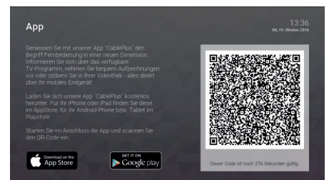
Mit der Mobile Connect Plus App das TV in der Tasche

OCILION IPTV Technologies GmbH Schärldinger Straße 35 4910 Ried im Innkreis Österreich T +43 7752 21 44 info@ocilion.com www.ocilion.com