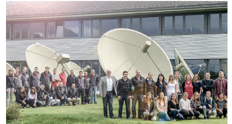
Kabelfernsehen Bodeli AG - eine große Familie

Die Software von Ocilion ist nicht nur für die Kunden der Kabelfernsehen Bodeli AG eine runde Sache. Auch das Unternehmen selbst genießt einige Services, die das daily business mit den TV-Kunden erleichtern. Das von Ocilion gelieferte Online Portal gibt dem Unternehmen aus dem Berner Oberland die Möglichkeit das System laufend im Auge zu behalten. So sieht man genau,