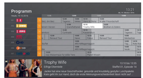
Die EPG Matrix gibt einen Überblick über die Sendungen