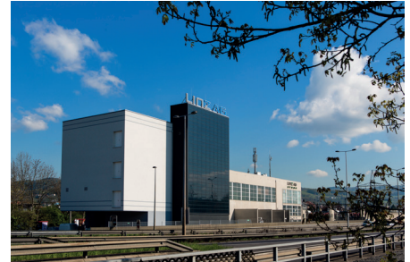
Das IT Data Center verfügt über 440m² Serverstellfläche

In Krisenräumen muss sichergestellt sein, dass relevante Informationen (z. B. offizielle Nachrichten) unmittelbar und uneingeschränkt zur Verfügung stehen. Mit iptv500 ist das kein Problem. Seit jeher ist die LINZ AG bestrebt im Bereich Versorgung Maßstäbe zu setzen. Durch den Einsatz von iptv500 bekommen das nicht nur die Linzer zu spüren, sondern auch die Mitarbeiter des Vorzeigeunternehmens. Bei der LINZ AG werden Mitarbeiter eben nicht nur gefordert, sondern auch gefördert.