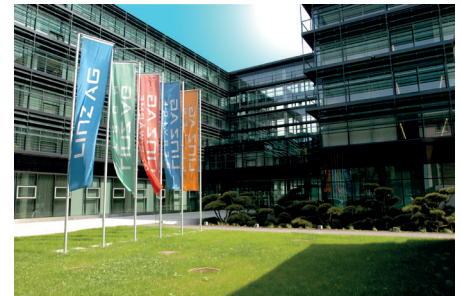
Die LINZ AG gehört zu 100% der Stadt und ihren Bürgern

Die LINZ AG beschreibt sich selbst als ein Unternehmen der allgemeinen Daseinsvorsorge und sichert die Grundversorgung der Menschen in Linz und Umgebung. „Linz“ steckt nicht umsonst im Unternehmensnamen. Die AG gehört der namensgebenden Stadt, oder dem Selbstverständnis der LINZ AG nach den Bürgern. Es handelt sich um ein öffentliches Unternehmen mit gemeinwirtschaftlichen Aufgaben. Die LINZ AG als stadteneigene Holding wurde 2000 durch eine Fusion gegründet.