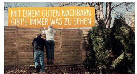
Citynet baut beim neuen Markenauftritt auf Regionalität...