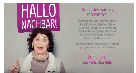
... und macht die eigenen Kunden zu Markenbotschaftern