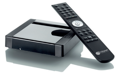
Mittels Branding wird das Ocilion IPTV zum Citynet Produkt

Für welche der zahlreichen Entertainment-Möglichkeiten man sich auch entscheidet, in Hall und Umgebung gibt es dank dem neuen Citynet IPTV immer was zu sehen.